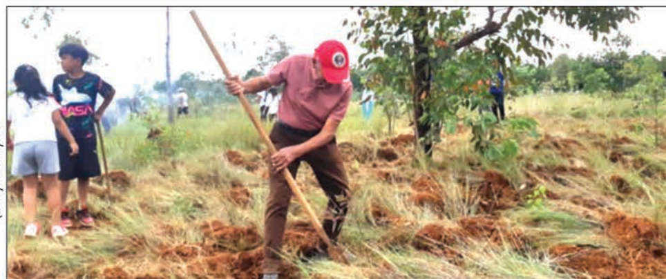
Nitarika ny fotoana ny filohan'ny Fiova