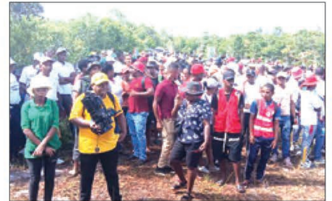
Lancement officiel de la campagne de reboisement 2025 dans la région Analanjirofo.