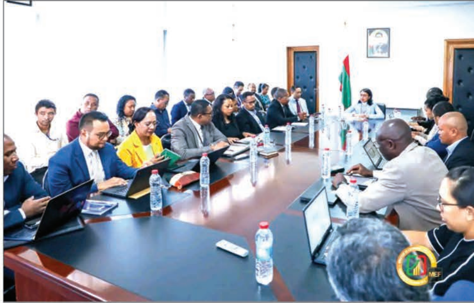
Séance de travail sur la coopération Banque mondiale-Madagascar, hier dans la salle de conférence du ministère de l'Économie et des Finances.

la transparence et la stabilité macro-budgétaire, la concurrence sur les marchés et la gouvernance d'entreprise dans les secteurs de l'énergie, des télécommunications et de