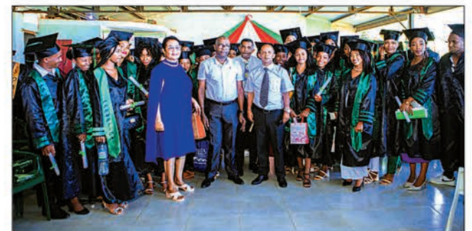
Les étudiants ont franchi un palier !

La sortie des cinquième et sixième promotions des étudiants de l'ISMADA, l'Institut Supérieur en Management des Affaires et du Développement d'Antsiranana, s'est tenue au cercle Mess de Diego-Suarez le 7 février dernier. 72 apprentis ont décroché leurs diplômes de Licence et de Master.