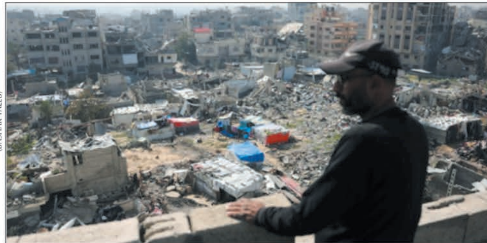
Un Palestinien regarde vers les dégâts à Jabalia, dans le nord de la bande de Gaza, le 17 février 2025.