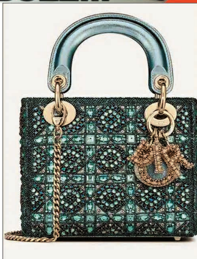
Le sac à main de 34 733 000 ariary, objet des frustrations de tout bord sur Facebook.