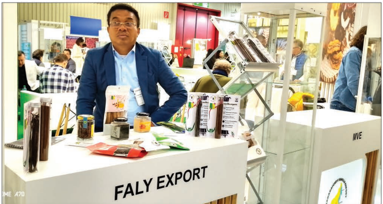
Parmi les produits bios exposés dans le cadre de cet événement d'envergure internationale.