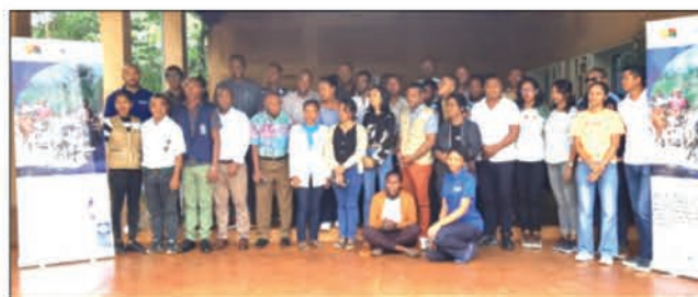
Telo andro no naharetan'ny atrikasa natao teto Antsirabe .