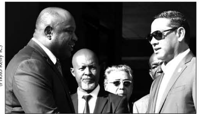
La FMGolf a effectué une visite de courtoisie au MJS, hier.