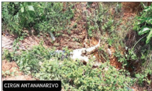
Découverte macabre, de bon matin hier, à Ambohimambola. Selon le constat du légiste accompagné par la gendar-

merie, le corps sans vie est âgé d'une trentaine d'années. Il ne présente aucune trace de blessure, écartant ainsi les éventuelles hypothèses de coups mortels. Le cadavre a été découvert par les riverains d'Andohamandry dans une canalisation d'eau. Pour le moment, le décès est supposé lié à un état d'ébriété ayant conduit au coma. L'inconscience et l'hypothermie durant le contact prolongé du corps avec l'eau dans le canal auraient certainement provo-