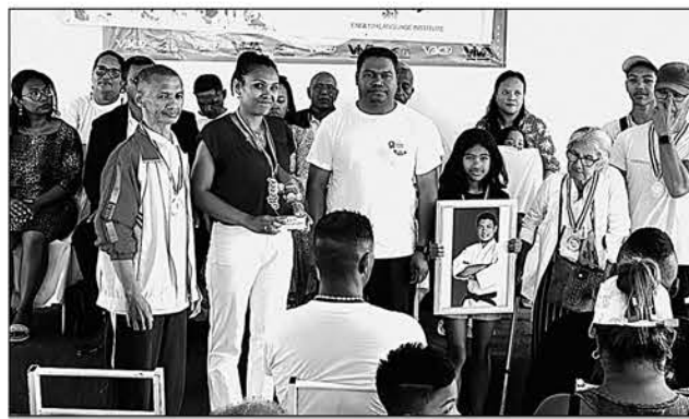
Célébration du 35 e anniversaire en grande pompe, ce dimanche.