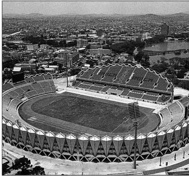
L'homologation du stade Barea reste en stand-by.