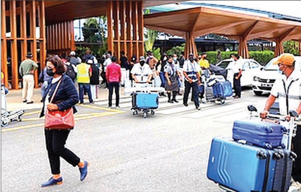
Le flux de passagers au terminal international d'Ivato a enregistré une croissance de 14% entre 2023 et 2024.

De mieux en mieux. La reprise de l'industrie aérienne malgache au niveau international se confirme. Ravinala Airports annonce une croissance du nombre de passagers enregistrés dans les aéroports dont elle a la charge.