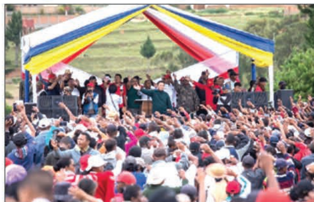
Le discours de Marc Ravalomanana au reboisement annuel du TIM attendu.

Deal. Durant la période électorale, le TIM n'a pas échappé