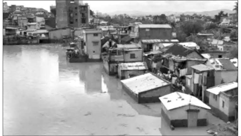
Les précipitations seront au rendez-vous dans les prochains jours.

le risque qu'une perturbation se développe dans le Canal de Mozambique est en hausse entre le 24 février et le 02 mars prochains. « Il y a un risque modéré pour le Centre Ouest et un risque faible pour le Centre Est de Madagascar », note le service. Les conditions devraient rester favorables au développement de la perturbation entre les 03 et 09 mars 2025. L'orga-