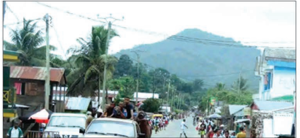
La nouvelle s'est répandue dans la commune.

Dimanche à 14 heures, un drame a secoué la commune rurale d'Ampanefena, district de Vohémar. La brigade locale a été alertée par Monsieur le Maire de la découverte d'un corps sans vie dans une rizière située à Antanimbarin'ny Ntaolo. Dès réception de l'information, trois éléments de la brigade territoriale d'Ampanefena, sous la direction d'un gradé et accompagnés d'un médecin, se sont rendus sur les lieux afin de procéder aux constatations et à l'ouverture d'une enquête. Sur place, les forces de l'ordre ont vu le corps d'un homme d'environ 30 ans, gisant sur le sol. Une blessure profonde, causée par un objet pointu, était visible au niveau de sa nuque, laissant fortement suspecter un acte criminel. D'après les témoignages des riverains, la victime était connue dans le secteur. Certains habitants rap-