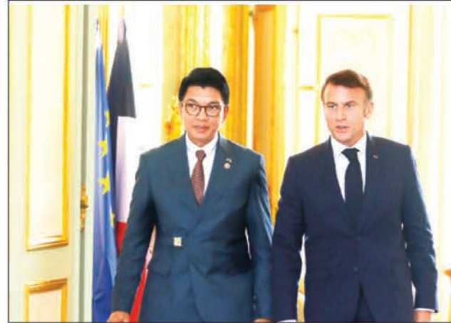
L'édition 2025 du Programme Young leaders se déroulera à Madagascar et sera coparrainée par les présidents Andry Rajoelina et Emmanuel Macron.