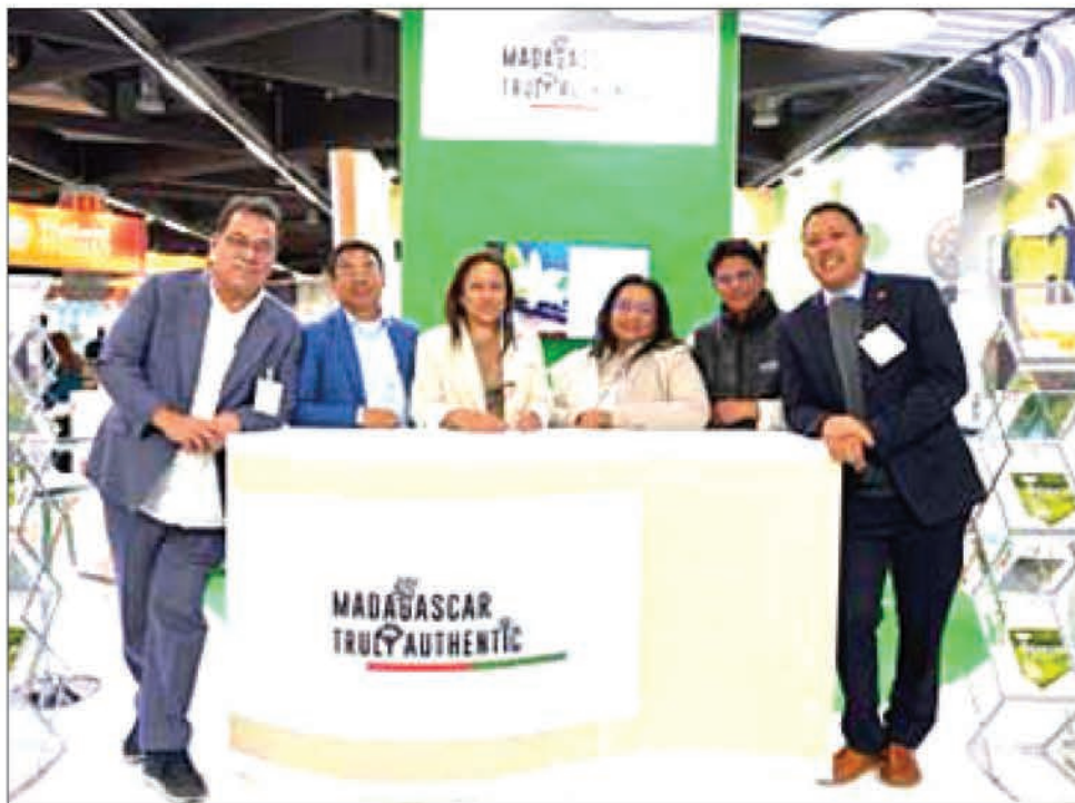
Les membres du Conseil d'administration du SYMABIO présents au salon BIOFACH en Allemagne.

La participation de Madagascar au salon BIOFACH ou salon leader mondial de l'alimentation et de l'agriculture biologique qui s'est tenu la semaine dernière à Nuremberg en Allemagne, a été une réussite.