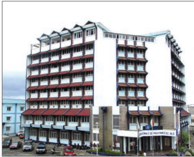
Siège de la coordination nationale du Pôle anti-corruption aux 67ha.

greffiers souhaitant intégrer ces pôles. Des postes comme avocat général, chef du ministère public, substitut général ou substitut du procureur, sont ouverts. Un comité d'évaluation a été mis en place pour examiner chaque dossier. Il est composé de représentants du