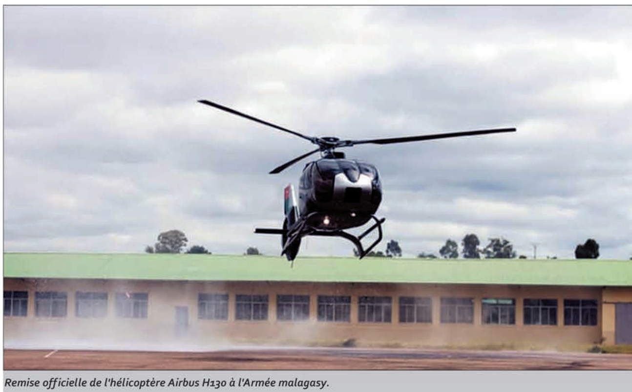
Remise officielle de l'hélicoptère Airbus H130 à l'Armée malagasy.