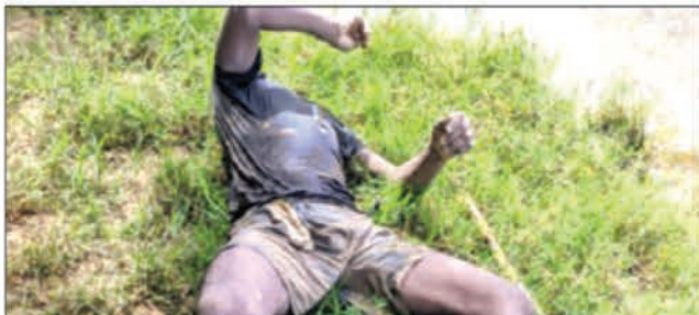
Vatana tsy nisy loha intsony no nampiakarina avy anaty rano.

Nitohy tahak'izay ihany koa ny tantara ho an'ireo roa lahy ambiny. Ny andron'ny nahitana ny fatin'ilay tapa-doha mantsy dia voasambotry ny fokolonona, tao Etrotroka, Farafangana izy roa lahy ary nentina tany amin'ny zandary. Ny ampitson'io, ny andron'ny zoma dia nezahina nampiakarina tao an-drenivohitr'i Farafangana izy ireo, saingy teny an-dalana dia nanao izay faraherin'izy ireo mba hitsoahana ireo nitondra azy. Voatery nampiasa hery ireo zandary, hoy ny vaovao, nent'ina nampijanana azy ireo, rehefa natao ny fampitandremana isan-karazany. Voan'ny bala izy roa lahy ary namoy ny ainy taorian'izay noho ny fahabetsahan'ny rà very. Mbola mitohy moa ny fanadihadiana mahakasika ity raharaha ity any an-toerana, raha ny fampitam-baovao azo hatrany. m.L